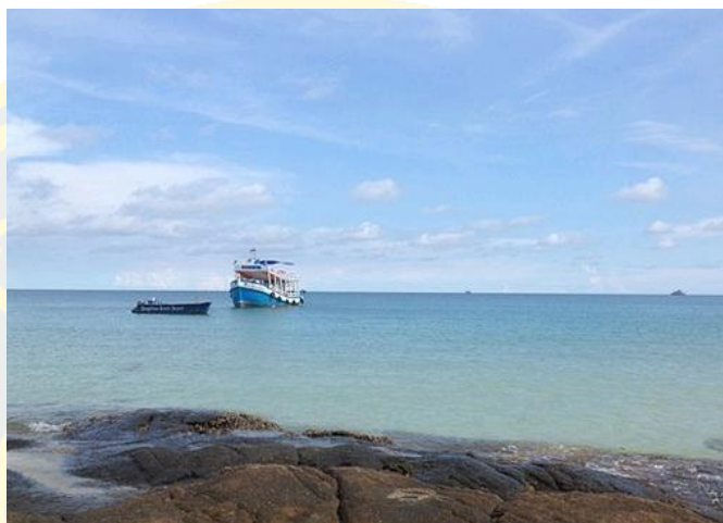
ภาพที่ 9 อ่าวเทียน

อ่าวเทียน เป็นอ่าวที่ผู้คนไม่ค่อยพลุกพล่าน ภาพของหาดทรายอ่าวเทียนมีความสะอาด ยามเมื่อน้ำทะเลลงจะมีปูเล็กปูน้อยเกาะอยู่ตามโขดหินให้ภาพที่สวยงามสบายตา อ่าวแห่งนี้ยังรักษาความสวยงามตามธรรมชาติ เป็นอ่าวที่เงียบสงบ เหมาะสำหรับการพักผ่อน