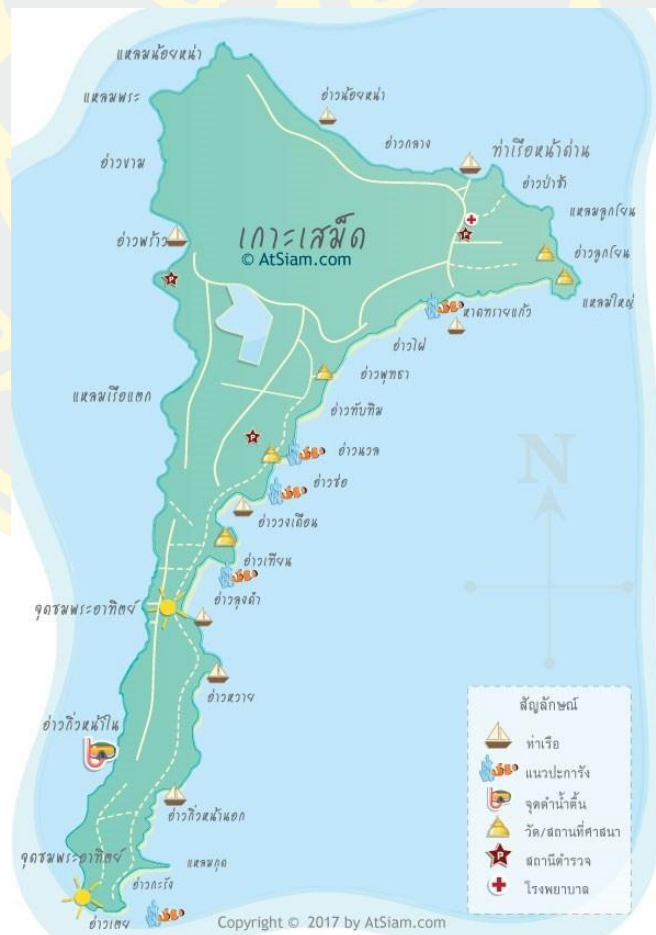
ภาพที่ 4 แผนที่ท่องเที่ยวเกาะเสม็ด (แอทสยามทัวร์, 2560)

สมกับชื่ออ่าวพร้าว ทั้งยังเป็นจุดชมพระอาทิตย์ตกที่สวยงามที่สุดของเกาะ ส่วนทางด้านตะวันออก มีอ่าวและชายหาดที่สวยงามหลายแห่งเรียงทอดยาวต่อเนื่องกัน เริ่มจากหาดทรายแก้วเป็น หาดทรายที่ยาวที่สุด กว้างและยาวเกือบ 1 กิโลเมตร ถัดมาเป็นอ่าวไผ่ อ่าวพุทรา อ่าวทับทิม อ่าวนวล อ่าวซ้อ อ่าววงเดือน ที่มีเอกลักษณ์หาดโค้งรูปวงเดือน อ่าวเทียน อ่าวหวาย และอ่าวกิว ที่มีทั้งความสวยงาม และยังมีแหล่งปะการังอยู่ใกล้ ๆ ชายฝั่ง ส่วนทางด้านใต้ของเกาะมีอ่าว ปะการัง ที่มีแหล่งปะการังที่สวยงามเหมาะแก่การดำน้ำตื้น ส่วนหัวแหลมด้านทิศใต้คือ แหลมใหญ่ช่องเกาะจันทร์ มีแนวหินชายฝั่งรูปร่างแปลก ๆ ไม่เหมาะที่จะเล่นน้ำ เพราะ ระดับน้ำทะเลลึกและมีน้ำวน แต่เป็นแหล่งตกปลาที่ดี เกาะเสม็ดจึงมีกิจกรรมท่องเที่ยวทางทะเล อย่างครบครัน ทั้งการชมวิทิวทัศน์ที่สวยงาม เล่นน้ำทะเลใส ๆ บนหาดทรายขาว ๆ ดำน้ำตื้น คุปะการัง หรือจะดำน้ำลึกสัมผัสผืนโลกใต้ท้องทะเล (สำนักงานการท่องเที่ยวและกีฬาจังหวัดระยอง, 2558)