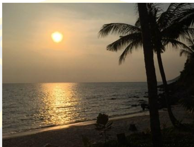
ภาพที่ 7 อ่าวพร้าว

อ่าวพร้าว เป็นจุดชมพระอาทิตย์ตกที่สวยงามที่สุดบนเกาะเสม็ด มีชายหาดยาว 200 เมตร ชายหาดมีทรายที่ขาวสะอาด ต้นมะพร้าวพรึ้วไปตามลมให้บรรยากาศเงียบสงบ และอ่าวพร้าวยังมีกิจกรรมให้เลือกทำมากมาย เช่น ดำน้ำชมปะการังน้ำตื้น พายเรือคายัค เป็นต้น