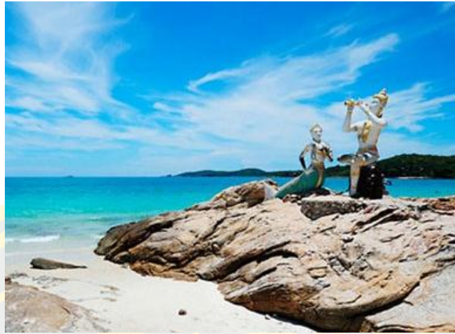
ภาพที่ 2 หาดทรายแก้ว (Alexzy, 2013)