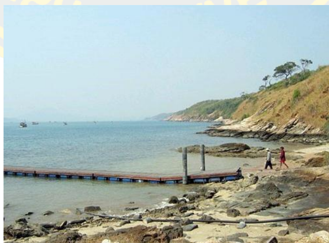
ภาพที่ 12 อ่าวกิว (แอสยามทัวร์, 2560)

อ่าวกิว เป็นส่วนที่แคบที่สุดของเกาะเสม็ด แบ่งเป็นอ่าวกิวใน และอ่าวกิวนอก ซึ่งเป็นจุดชมอาทิตย์ขึ้น และพระอาทิตย์ตก อ่าวกิวในส่วนใหญ่เป็นแนวโขดหินไม่เหมาะแก่การเล่นน้ำแต่เหมาะที่จะเป็นจุดชมวิว ตัดกับบรรยากาศของเกาะเสม็ดที่สวยงาม