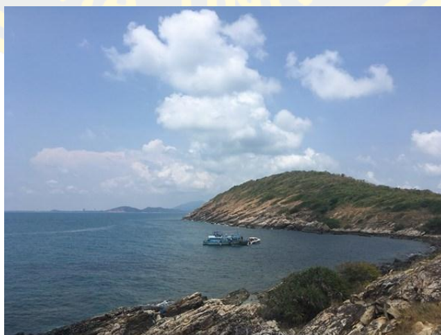
ภาพที่ 14 จุดชมวิวท้ายเกาะ (แอสยามทัวร์, 2560)

จุดชมวิวท้ายเกาะ มีพื้นที่เป็นหน้าผาชัน และโขดหิน โดยเหมาะสำหรับเป็นจุดชมวิว และเป็นจุดชมพระอาทิตย์ตก สามารถมองเห็นวิวออกไปสู่ฝั่งแผ่นดิน และได้บรรยากาศโรแมนติกในยามเย็น