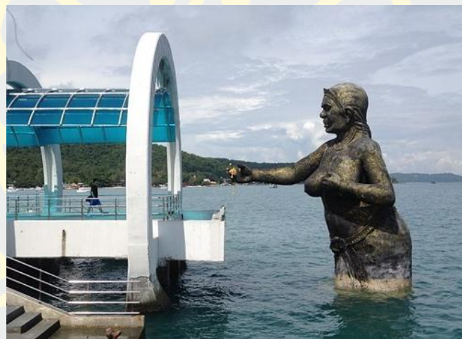
ภาพที่ 3 ท่าเทียบเรือเกาะเสม็ด (แอสยามทัวร์, 2560)