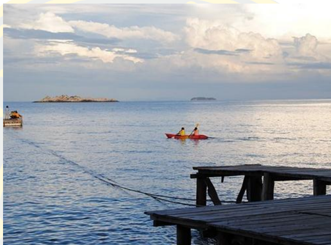
ภาพที่ 13 อ่าวปะการัง

อ่าวปะการัง อยู่บริเวณท้ายเกาะเสม็ด อ่าวแห่งนี้เป็นแนวปะการังน้ำตื้น เป็นอ่าวที่เงียบสงบ และผู้คนไม่พลุกพล่านอย่างแท้จริง มีพื้นที่หาดทรายขนาดเล็ก แต่พอที่จะลงเล่นน้ำและชมปะการังได้ อ่าวนี้เชื่อมต่อกับบริเวณแหลมกูด ซึ่งเป็นจุดชมวิวพระอาทิตย์ขึ้นและตกที่สวยงาม จุดหนึ่งที่ไม่ควรพลาด ในช่วงเดือน พ.ย.-ธ.ค. จะเป็นช่วงที่มีปลาอินทรีชุกชุมมาก