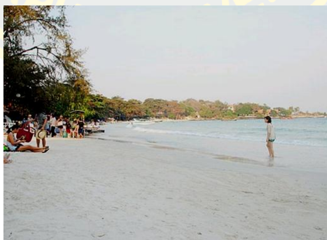
ภาพที่ 8 อ่าววงเดือน (แอสยามทัวร์, 2560)

อ่าววงเดือน อ่าวโค้งเว้าเป็นรูปพระจันทร์ครึ่งดวง ทอดตัวยาวกว่าครึ่งกิโลเมตร เป็นอ่าวที่มีสีสันบรรยากาศหลากหลายอารมณ์ ถ้าต้องการความสงบเงียบด้านหลังอ่าวเป็นหน้าผาจุดชมพระอาทิตย์ตกดินที่สวยงามอีกจุดหนึ่ง