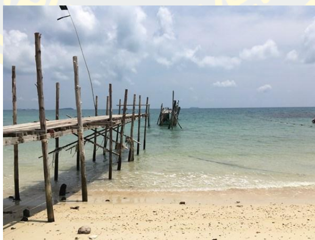
ภาพที่ 10 อ่าวลุงดำ

อ่าวลุงดำ มีหาดทรายสวย น้ำทะเลใสสะอาด อยู่ติดกับอ่าวเทียน อ่าวลุงดำมีเอกลักษณ์พิเศษ คือ สะพานไม้ที่ยื่นเหยียดยาวออกไปในทะเล มีปลาชุกชุม สามารถนั่งเล่นกินลม ชมวิวพร้อมกับรับประทานอาหารและเครื่องดื่ม และสามารถชมพระอาทิตย์ขึ้นและตกได้ที่นี้