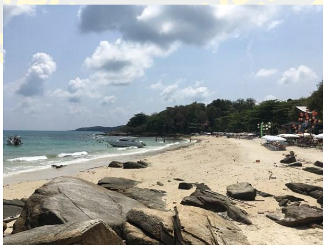
ภาพที่ 6 อ่าวไผ่ (แอสยามทัวร์, 2560)

อ่าวไผ่ ชายหาดถัดไปจากหาดทรายแก้วคั่นกันแค่โขดหิน สามารถเดินเล่นถึงกันได้ มีวิวทิวทัศน์ที่สวยงาม น้ำทะเลใส เหมาะแก่การถ่ายรูป บริเวณอ่าวไผ่จะเป็นอีกแห่งหนึ่งที่จะเห็น นักท่องเที่ยวต่างชาตินอนอาบแดดจนเป็นลักษณะเฉพาะของอ่าวไผ่ แม้อ่าวไผ่จะสงบเงียบ กว่าหาดทรายแก้ว แต่ก็มีบรรยากาศสีสนั่นของแสงไฟให้นักท่องเที่ยวได้เพลิดเพลินในยามค่ำคืน