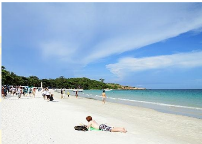
ภาพที่ 5 หาดทรายแก้ว

หาดทรายแก้วเป็นชายหาดไม่มีโขดหิน จึงเป็นแหล่งรวมกิจกรรมทางน้ำทุกประเภท และหาดแห่งนี้ ยังคึกคักไปด้วยร้านอาหารและเสียงเพลง บรรยากาศแห่งการดื่มกินริมทะเลยามค่ำคืนอีกด้วย