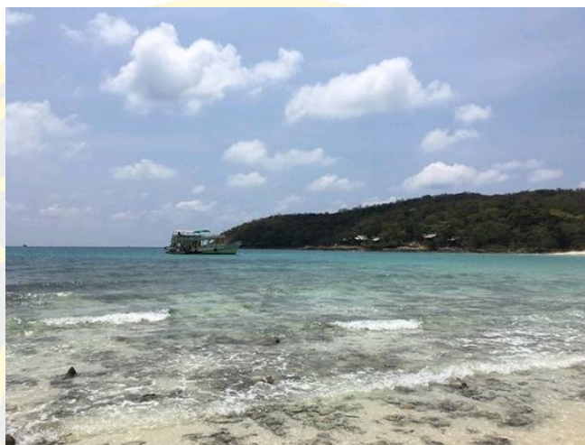
ภาพที่ 11 อ่าวหวาย

อ่าวหวาย เหมาะกับการท่องเที่ยวพักผ่อนแบบส่วนตัว เพราะมีธรรมชาติสวยงาม ร่มรื่นด้วยต้นเทียนตลอดแนวชายหาด มีหาดทรายขาวละเอียดเหมาะแก่การเล่นน้ำ มีโขดหินยื่นออกไปสำหรับนั่งชมวิว อ่าวแห่งนี้มีความสวยงามของธรรมชาติที่ควบคู่ไปกับบรรยากาศที่สงบ