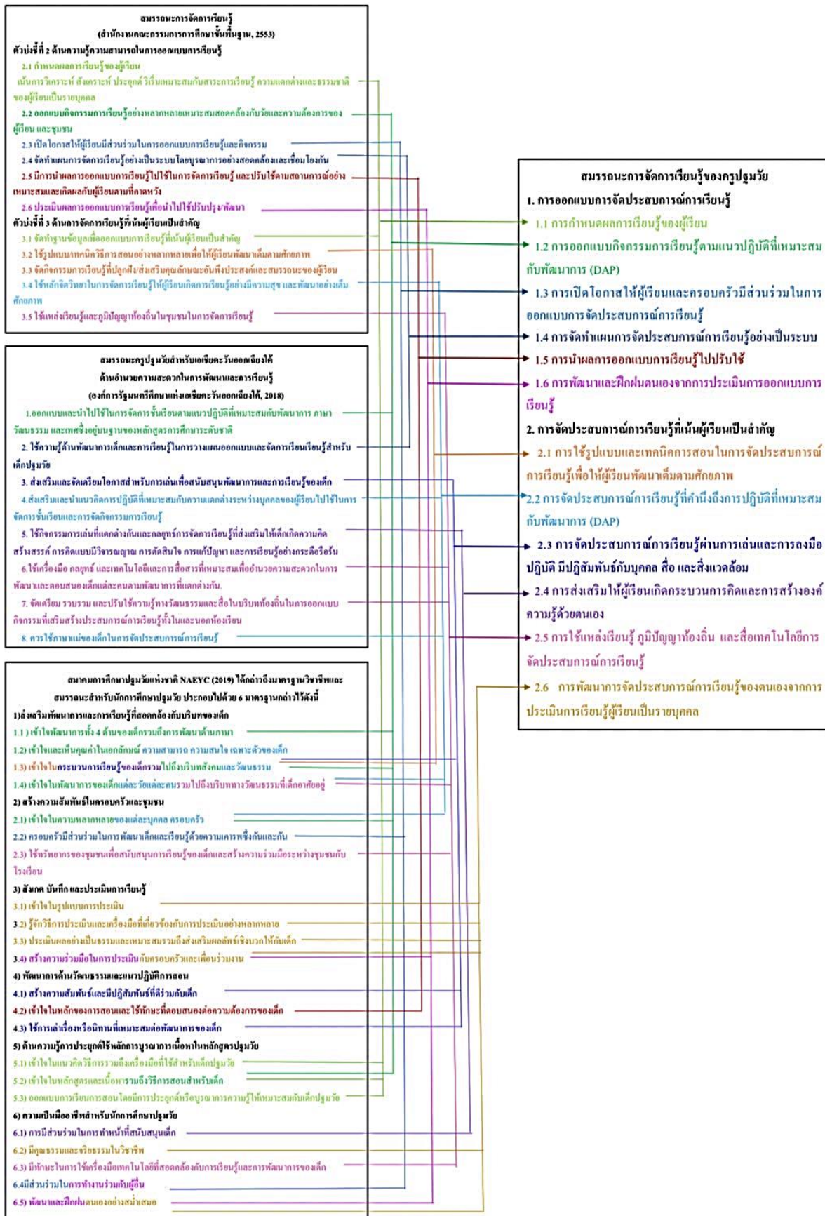
ภาพที่ 1 การสังเคราะห์กรอบแนวคิดการวิจัย