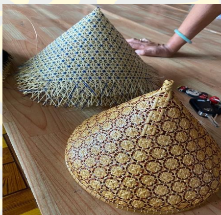
ภาพที่ 5 ฝาชีดาวล้อมเดือน

กระทรวงวัฒนธรรม กระทรวงอุดมศึกษา วิทยาศาสตร์ วิจัยและนวัตกรรม หน่วยบริหารและจัดการ ทุนด้านการพัฒนาระดับพื้นที่ เทศบาลเมืองพนัสนิคม และคนในชุมชนพนัสนิคม ในการจัดพื้นที่และ กิจกรรมภายในงาน ทั้งการแสดงดนตรีท้องถิ่น การออกร้านขายอาหารพื้นเมืองและผลิตภัณฑ์ท้องถิ่น โดยพนัสนิคมเป็นหนึ่งในพื้นที่ 20 พื้นที่ทั่วประเทศที่ผ่านการคัดเลือก เพื่อการพัฒนาทุนทาง วัฒนธรรมชุมชนผ่านกลไกองค์กรปกครองส่วนท้องถิ่นและประชาสังคม มีเป้าหมายกระตุ้นให้เกิดการ ท่องเที่ยวเชิงวัฒนธรรมของพื้นที่ สร้างย่านวัฒนธรรม สร้างพื้นที่แสดงผลงานสำหรับศิลปินและคนรุ่นใหม่ สร้างความหลากหลายของธุรกิจในระบบเศรษฐกิจชุมชน และเพิ่มการมีส่วนร่วมของประชาชน ในพื้นที่ ผ่านการจัดถนนวัฒนธรรมที่ประกอบไปด้วย อาหาร ดนตรี ประเพณี รวมทั้งมีการขายสินค้า และการเผยแพร่งานหัตถกรรมจักสานที่มาจากกลุ่มของชุมชน เป็นการกระตุ้นเศรษฐกิจในพื้นที่ หลังจากการระบาดของ COVID - 19 และร่วมสืบสานวัฒนธรรมประจำท้องถิ่นไม่ให้หายไป (บ้านसानใจ, 2566)