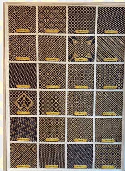
ภาพที่ 3 ลายจักสาน (ห้องสมุดประชาชนเฉลิมราชกุมารี, 2561)