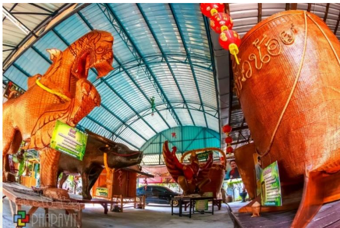
ภาพที่ 4 ศูนย์จักสานใหญ่ที่สุดในโลก (thiteaw, 2557)

โดยมีปัจจัยทางด้านสังคมและวัฒนธรรม อันได้แก่ การรวมกลุ่มของผู้ผลิตในชุมชนเพื่อจัดตั้งกลุ่มจักสานร่วมกัน เจตนารมณ์ของประธานชุมชนที่อยากจะสืบสานและอนุรักษ์ภูมิปัญญาหัตถกรรมจักสาน และการเข้ามาของโครงการ หนึ่งตำบล หนึ่งผลิตภัณฑ์ (OTOP) และปัจจัยทางด้านเศรษฐกิจ อันได้แก่ กิจกรรมทางเศรษฐกิจในพื้นที่และแนวคิดต่อยอดของกลุ่ม ได้ส่งผลต่อบทบาทและความสำคัญของหัตถกรรมจักสานในช่วงเวลาดังกล่าว จนเกิดการรวมกลุ่มและจัดตั้งกลุ่มของคนในชุมชนเพื่อดำเนินกิจกรรมเกี่ยวกับหัตถกรรมจักสาน โดยมีการพัฒนาและเติบโตขึ้นตามลำดับ รวมทั้งมีการเข้ามาของหน่วยงานต่าง ๆ ทั้งในบทบาทของการร่วมก่อตั้งและการเข้ามาสนับสนุนทั้งรูปแบบเงินสนับสนุน การจัดโครงการ กิจกรรม การประชาสัมพันธ์ และการฝึกอบรมให้ความรู้จากหน่วยงาน เช่น เทศบาลเมืองพนัสนิคม สำนักงานพัฒนาชุมชนอำเภอพนัสนิคม มูลนิธิศิลปะชีพ กระทรวงพาณิชย์ กรมส่งเสริมการค้าระหว่างประเทศ กรมส่งเสริมอุตสาหกรรม กรมส่งเสริมวัฒนธรรม กรมการพัฒนาชุมชน ททท. และสถาบันศิลปหัตถกรรมไทย เป็นต้น นำไปสู่การเกิดขึ้นของกลุ่มและศูนย์หัตถกรรมจักสานในพื้นที่ จนกลายเป็นแหล่งผลิต แหล่งจัดจำหน่าย แหล่งท่องเที่ยว รวมทั้งแหล่งเรียนรู้ภูมิปัญญาหัตถกรรมจักสานในตำบลพนัสนิคม