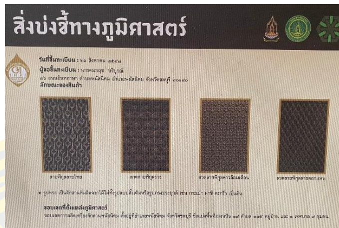
ภาพที่ 2 สิ่งบ่งชี้ทางภูมิศาสตร์ไทย “เครื่องจักสานพนัสนิคม” (ศูนย์ส่งเสริมฝีมือจักสานด้วยไม้ไผ่, 2561)