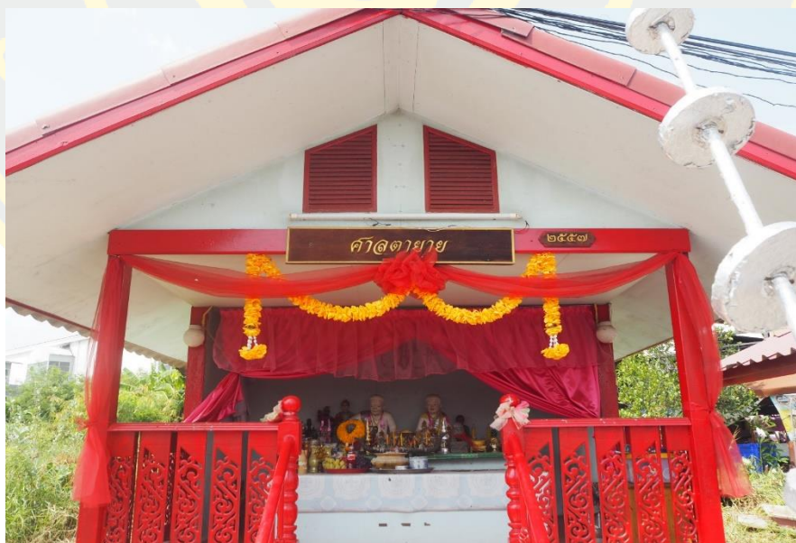
ภาพที่ 4-4 ศาลตายาย ซึ่งอยู่ติดกับศาลเจ้าพ่อไกรวัลย์พันธุ

ดังตัวอย่าง ภาพของการเปลี่ยนแปลงด้านศาสนสถานภายในชุมชนตลาดโบราณบางพลี ในช่วงเวลาที่ศึกษา นั่นคือ ศาลตายาย ที่สร้างขึ้นในปี พ.ศ.2557