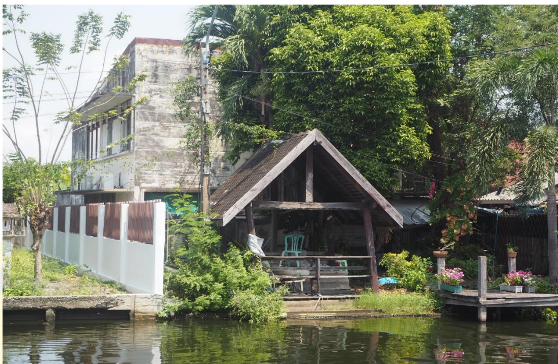
ภาพที่ 4-8 ธนาคารออมสินสาขาบางพลี (เดิม) ซึ่งตั้งอยู่ริมคลองตำโรงบริเวณชุมชนตลาด โบราณบางพลี