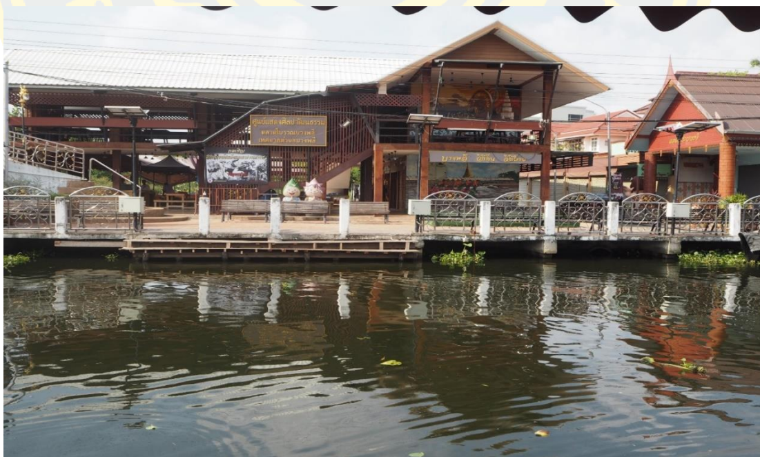
ภาพที่ 4 - 10 ศูนย์ศิลปวัฒนธรรมบางพลี