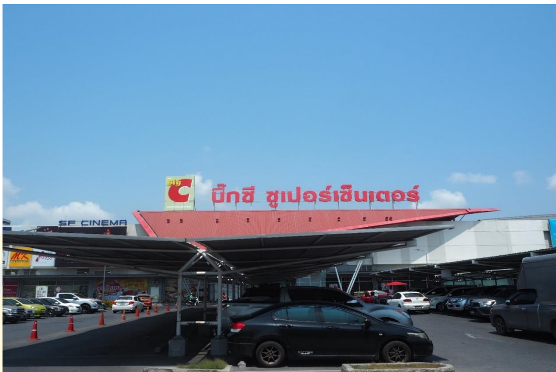
ภาพที่ 4 - 11 ห้างสรรพสินค้าบิ๊กซี สาขาบางพลี

จากข้อมูลทั้งหมดข้างต้นสรุปได้ว่า เมื่อมีการตัดถนนซึ่งเป็นเส้นทางสัญจรทางบกออกไปสู่ภาคตะวันออกโดยรอบชุมชนหลายเส้นทาง ทำให้การสัญจรทางน้ำถูกลดบทบาทลงและทำให้สิ่งปลูกสร้างต่าง ๆ ที่เคยปรากฏริมคลองลำโรง เปลี่ยนแปลงที่ตั้งไป และในเวลาต่อมาเกิดการเกิดขึ้นของห้างสรรพสินค้าบิ๊กซี บางพลี เป็นศูนย์การค้าที่มีความทันสมัยดึงดูดความสนใจให้ผู้คนเข้าไปซื้อสินค้ามากกว่าภายในชุมชนตลาดโบราณบางพลี เนื่องจากมีสิ่งของหลากหลายประเภทและสิ่งอำนวยความสะดวกครบครัน ถึงแม้ว่าการเปลี่ยนแปลงท่ามกลางความเจริญของสังคมจะมีเข้ามาตลอด แต่ชาวชุมชนยังคงรักษาสถาปัตยกรรมสำคัญที่เป็นสัญลักษณ์ของชุมชนเอาไว้ได้เป็นอย่างดีจนได้รับรางวัลพระราชทาน แม้จะเกิดเหตุเพลิงไหม้ตลาดไปบางส่วนชาวชุมชนสามารถปรับเปลี่ยนพื้นที่เสียหาย มาใช้เป็นจุดอำนวยความสะดวกให้ผู้ที่มาท่องเที่ยวได้ผ่อนคลาย และชมความงดงามของศูนย์ศิลปวัฒนธรรมบางพลี ที่มีรูปแบบสถาปัตยกรรมร่วมสมัย ที่ภายในเต็มไปด้วยเรื่องราวอันทรงคุณค่าของชุมชนตลาดโบราณบางพลี