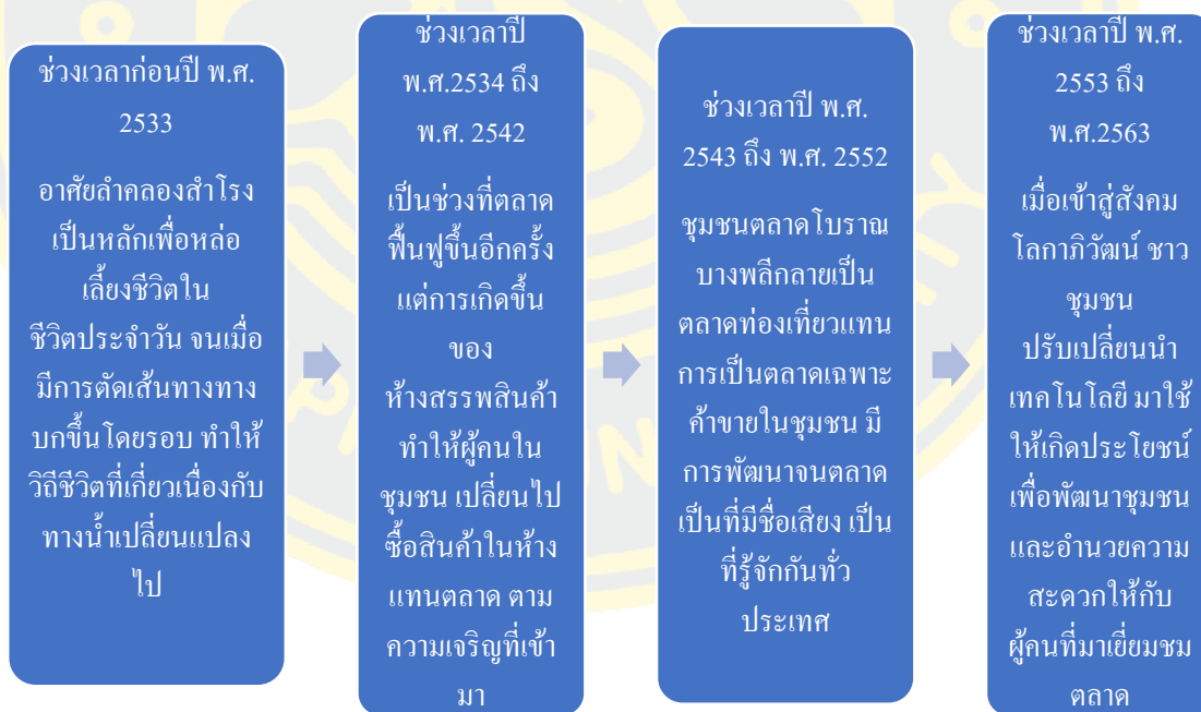
ภาพที่ 4 - 5 แผนภาพพัฒนาการด้านการเปลี่ยนแปลงทางวิถีชีวิตของชุมชนตลาดโบราณบางพลี

โดยสามารถแสดงแผนภาพพัฒนาการของลักษณะการเปลี่ยนแปลงด้านวิถีชีวิตความเป็นอยู่ของชาวชุมชนตลาดโบราณบางพลี ได้ดังภาพต่อไปนี้