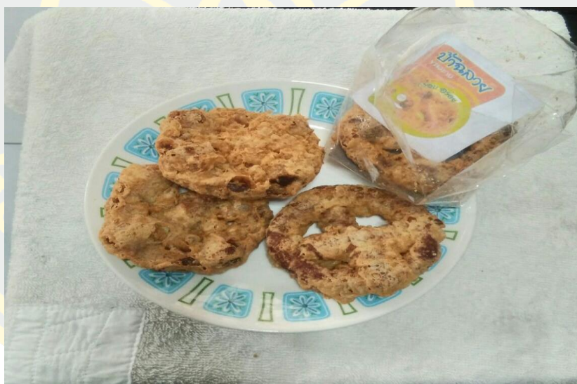
ภาพที่ 4 - 6 ขนมกง

ตัวอย่างของภูมิปัญญาท้องถิ่นของชุมชนตลาดโบราณบางพลีอันเป็นเอกลักษณ์นั้นคือ ขนมกง และประเพณีรับบัว ดังภาพต่อไปนี้