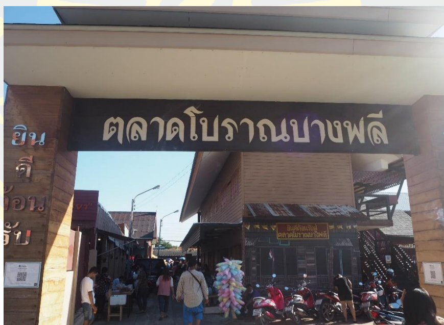
ภาพที่ 4 - 2 ทางเข้าชุมชนตลาดโบราณบางพลี บริเวณศูนย์ศิลปวัฒนธรรมบางพลี