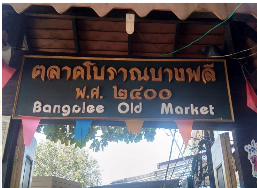
ภาพที่ 4 - 3 ทางเข้าชุมชนตลาดโบราณบางพลีบริเวณวัดบางพลีใหญ่ใน พระอารามหลวง

จากข้อมูลทั้งหมดข้างต้นสรุปได้ว่า ที่ตั้งของชุมชนตลาดโบราณบางพลีในช่วงปี พ.ศ. 2533 ถึง พ.ศ. 2563 ยังไม่เกิดการเปลี่ยนแปลงไปจากเดิม นั่นคือตั้งอยู่บริเวณฝั่งตรงข้ามห้างสรรพสินค้าบิ๊กซี สาขาบางพลี และอยู่ติดกับวัดบางพลีใหญ่ใน พระอารามหลวง ในท้องที่เทศบาลตำบลบางพลีริมคลองสำโรง ซึ่งเป็นบริเวณเดียวกันกับเมื่อแรกเริ่มก่อตั้งชุมชนตลาดเมื่อปี พ.ศ.2400 หรือเมื่อราว 160 ปีที่แล้ว