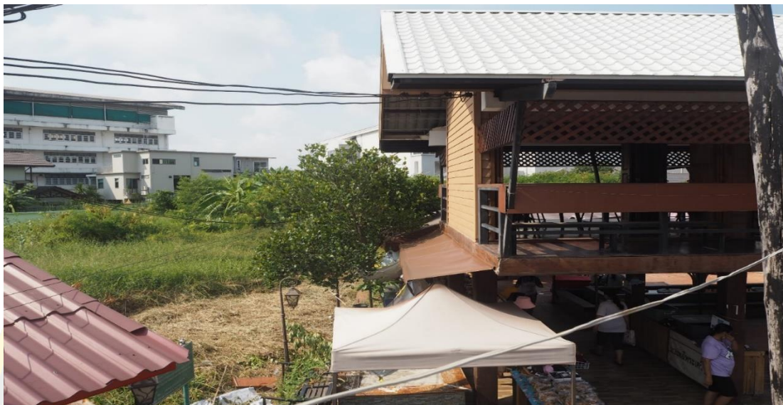
ภาพที่ 4 - 9 สถาปัตยกรรมรูปแบบลอฟท์ (รูปแบบยกสูง) แบบร่วมสมัย ภายในศูนย์ ศิลปวัฒนธรรมบางพลี