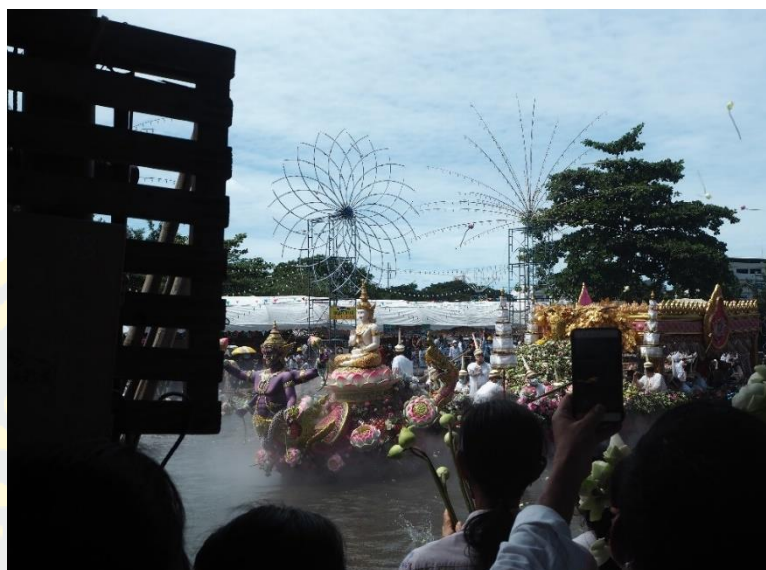
ภาพที่ 4-7 ประเพณีรับบัว

จากข้อมูลทั้งหมดข้างต้นสรุปได้ว่า การเปลี่ยนแปลงด้านภูมิปัญญาภายในชุมชนตลาดโบราณบางพลีในระยะเวลา 30 ปีที่ผ่านมา นั้น ชาวชุมชนยังคงรักษาภูมิปัญญาดั้งเดิมเอาไว้ได้เป็นอย่างดี โดยเฉพาะในด้านอาหาร สิ่งที่เพิ่มขึ้นมาคือ การที่หน่วยงานภาครัฐเข้าไปแสวงหาวิธีการสร้างรายได้ให้กับชาวชุมชนซึ่งภายหลังพัฒนากลายเป็นภูมิปัญญา นอกจากนี้ภูมิปัญญาที่มีอยู่เดิมได้ถูกปรับรูปแบบให้เข้ากับยุคสมัย ส่วนภูมิปัญญาที่สูญหายไปนั้นเกิดจากเหตุอัคคีภัยครั้งใหญ่ภายในชุมชนทำให้ไม่สามารถฟื้นฟูให้กลับมาเป็นดังเดิมได้อีกต่อไป