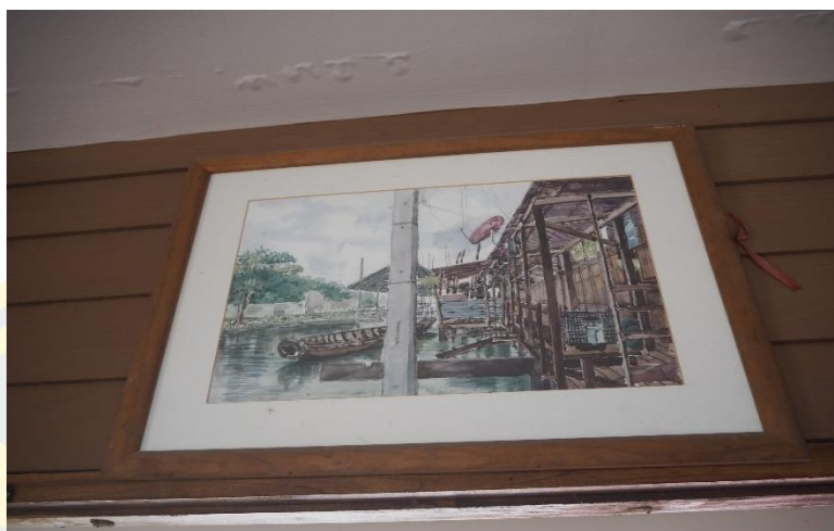
ภาพที่ 4 - 1 ลักษณะที่ตั้งของชุมชนตลาดโบราณบางพลีในอดีต